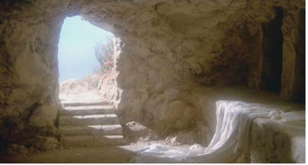
येशूला लास थान्वा धुर्सा

तिग धुर्साएनोन थान्थान तमुला? चु खाह्ण्ड्वा धुर्सा हिन्ना ? चु किताबला मिन थे:मैछ्याम ह्ण्डला सेमरी चु प्रश्नगदे खजी तला । थान्थान धुर्सा भिमा ह्ण्ड उदेक थातउ । तिगदा भिसम चु सत्य ताम हिन्ना । चु ताम खालै म्हिसे खेन्जी पाड्वा ताम आहिन । य्हाड म्हि य्हुल्ला पापला दोष मेटप लबारीदेन सेमला जम्मान दुखगदेग्याम फेसी य्हाडदा परमेश्वरला भ्ण्डा भ्ण्डामे स्होबाला लागिरी येशू खीष्ट म्हि दोसी चु पापसे